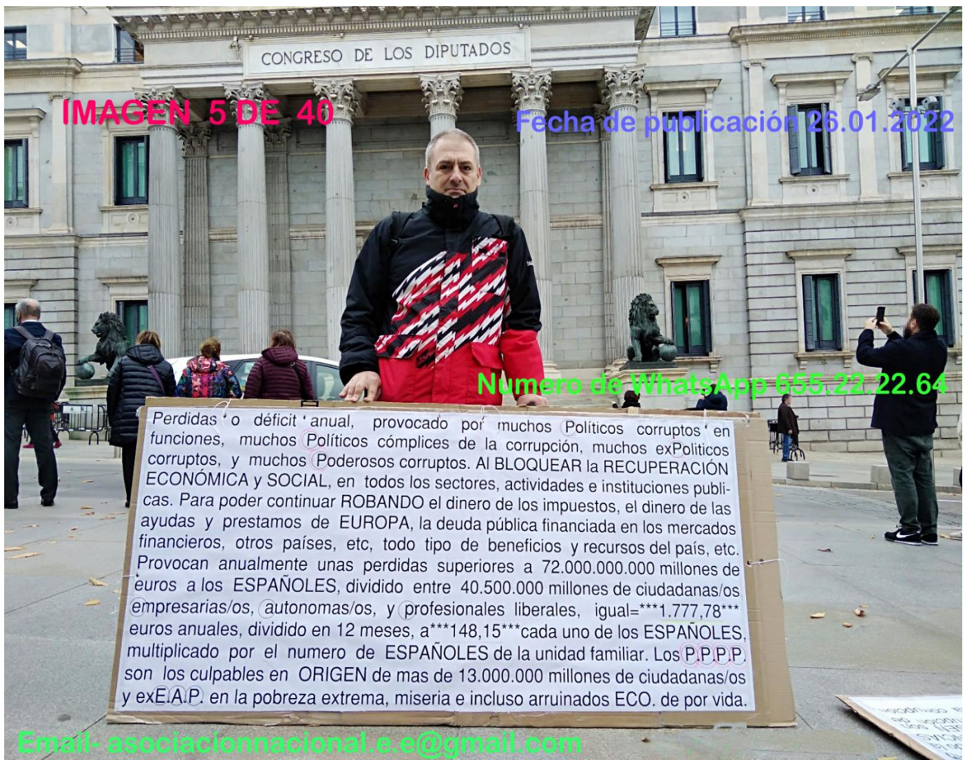
IMAGEN 5 DE 40

Para salir de la grave crisis microeconómica y macroeconómica, que arrastramos desde el año 2008, más la actual del Covid-19 y la guerra de Ucrania y Rusia. Para aumentar el empleo estable y digno, aumentar el consumo, la estabilidad y continuidad del tejido productivo español, etc., y el estado español, siempre que defienda los intereses de todas las españolas y españoles, en lugar de los intereses de muchos políticos corruptos y sus cómplices y muchos poderosos corruptos y sus cómplices.