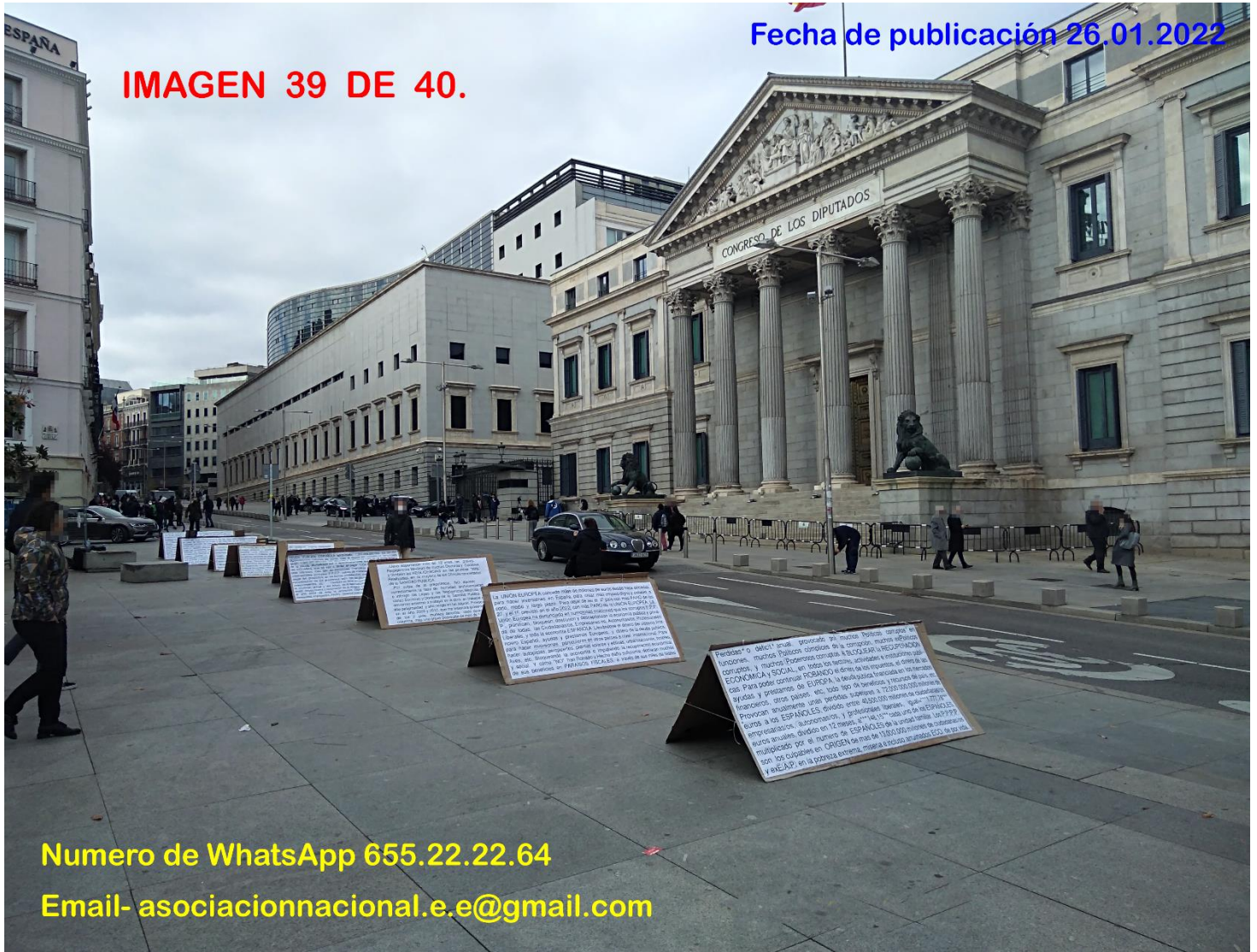
IMAGEN 39 DE 40.