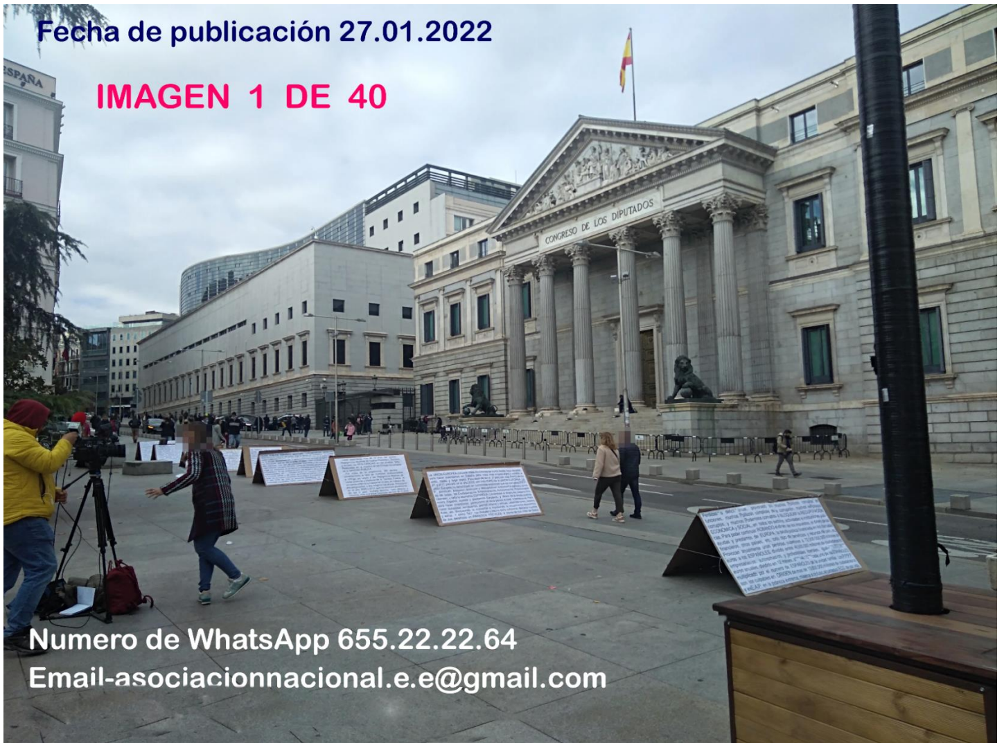
IMAGEN 1 DE 40

Numero de WhatsApp 655.22.22.64 Email-asociacionnacional.e.e@gmail.com